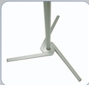
Der Fuß des Pole System setzt Maßstäbe in Sachen Funktionalität und Design.