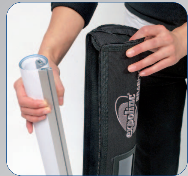
Jedes Panel hat seine eigene Tasche