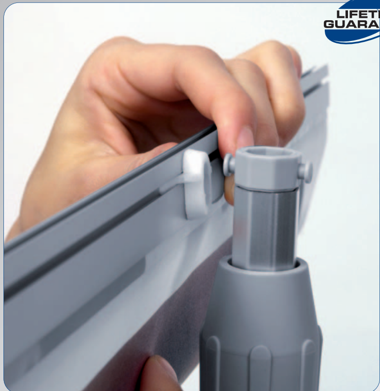
Panel einhängen, Display auf die gewünschte Höhe ausfahren - fertig.