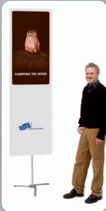
Das Pole System ist bis 2,50 m Höhe einsetzbar.

individuell einstellen. Das mit 3 kg sehr leichte, aber trotzdem äußerst stabile, Pole System kann auch beidseitig mit Grafikpanels in den Breiten 55, 70, 85 oder 100 cm bestückt werden. Als Zubehör kann das Pole System mit dem 50 Watt starken Halogenstrahler „Premium“ kombiniert werden.