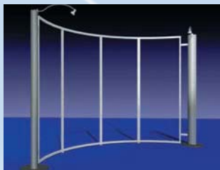
TL 2 (TL 2.1 gerade)