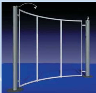
TL 1 (TL 1.1 gerade)

The "heart" of the system is the elliptical support, with concealed system mechanism, along with a profile frame for securing graphic panels. Titan Line can also be easily transported by car.